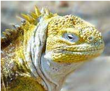
Der Galapagos-Land Leguan