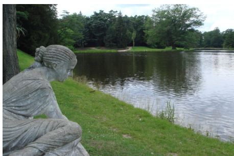
Muschelnympe am Seeufer