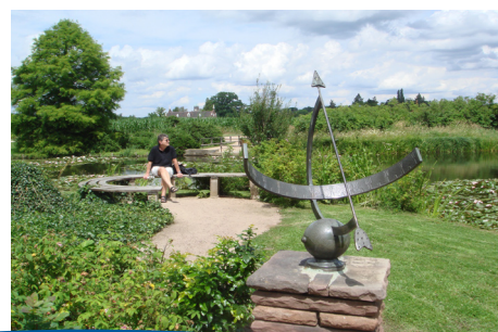
Roseninsel im Wörlitzer See