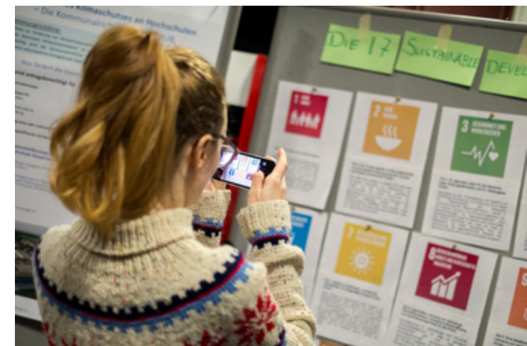
Strukturen stärken 2017