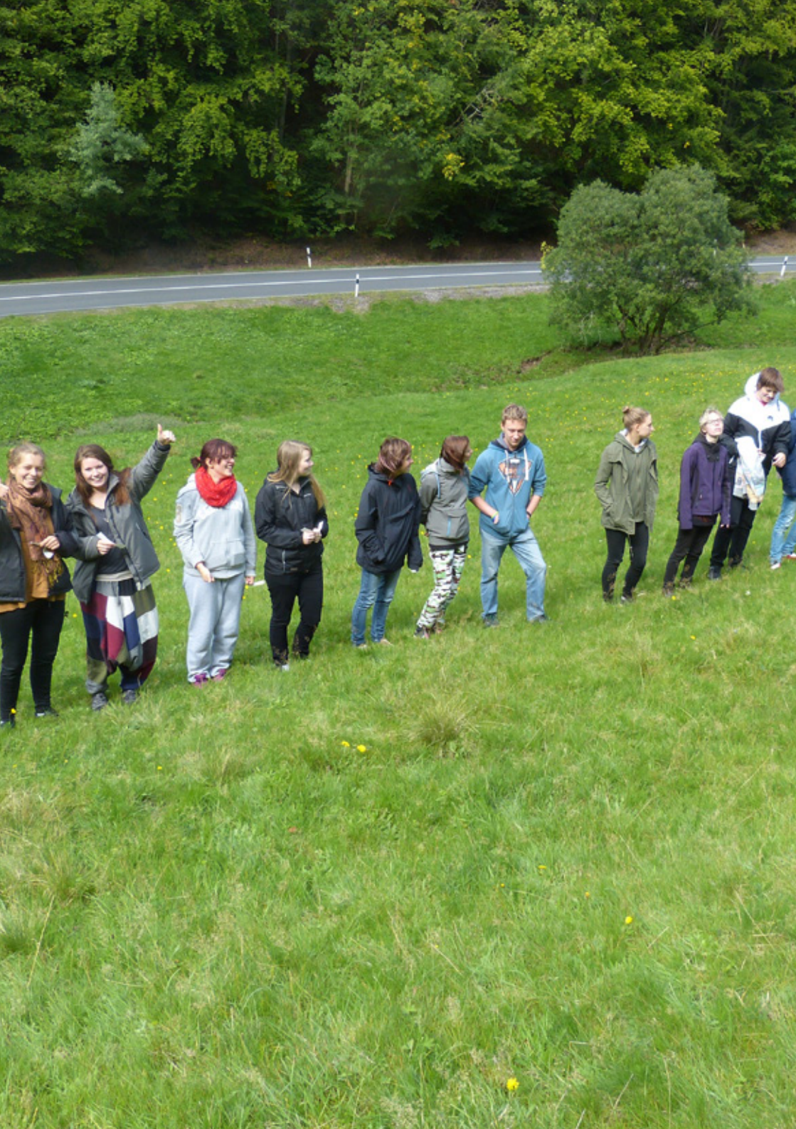
Strukturen stärken 2017