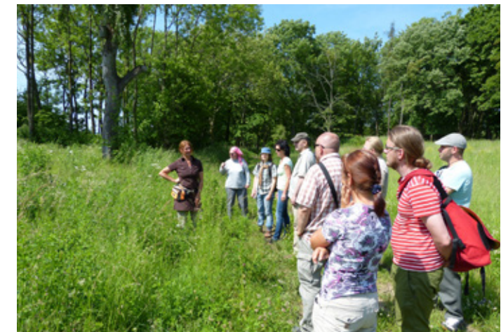
Strukturen stärken 2017