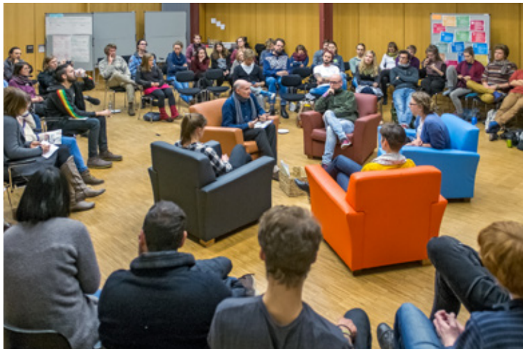
Strukturen stärken 2017

Referenzrahmen bilden auch die nachhaltigen Entwicklungsziele (Sustainable Development Goals, SDGs) der Vereinten Nationen. Die Jahreskonferenz 2016 „konferenz n – Hochschule weiter denken“ beschäftigte sich daher mit der Leitfrage „Studentisches Engagement für nachhaltige Hochschulen – Alles neu durch die Sustainable Development Goals?“ Das Leitbild der SDGs böte den Hochschulen die Möglichkeit, ihre Beiträge zur nachhaltigen Entwicklung in Lehre, Forschung, Betrieb und Governance transparent zu machen. Auch an der Kommentierung der Neuauflage der Deutschen Nachhaltigkeitsstrategie hat sich Netzwerk n e.V. beteiligt – schließlich geht es darum, nicht nur die deutsche Hochschullandschaft nachhaltig zu verändern, sondern auch mithilfe studentischen Engagements positiven Einfluss auf die gesamte Gesellschaft nehmen zu können.