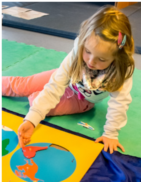
Strukturen stärken 2017