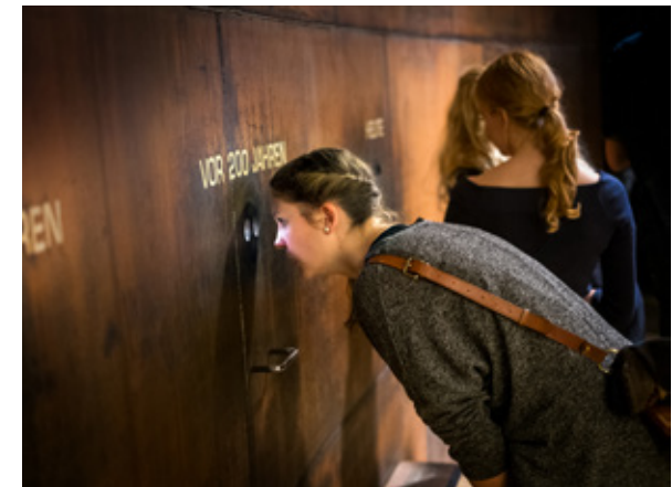
Strukturen stärken 2017