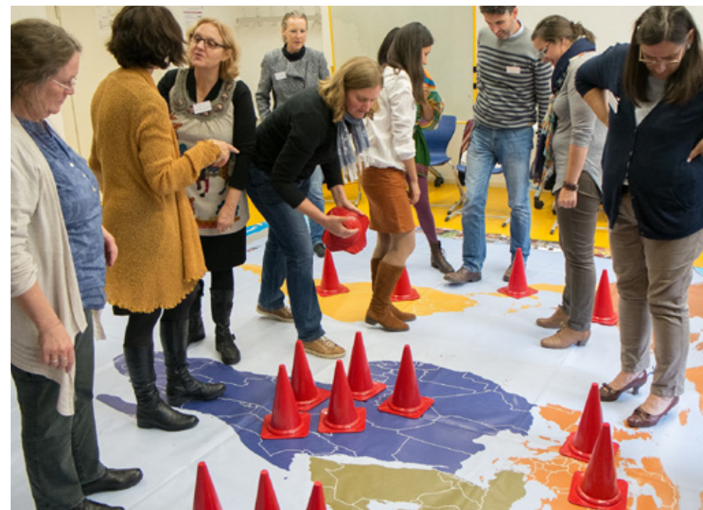
Strukturen stärken 2017