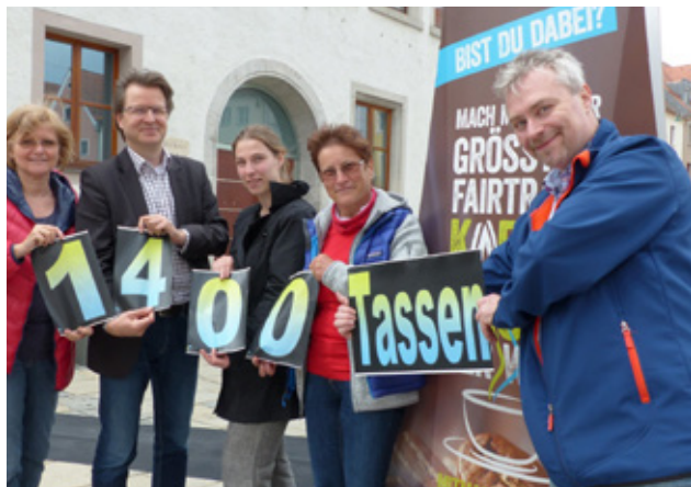
Strukturen stärken 2017

Während bei der Kommunikation innerhalb der Stadt Neumarkt noch Optimierungsbedarf besteht, läuft es mit der Außenkommunikation umso besser. Durch die Auszeichnung als Kommune des Weltaktionsprogramms Bildung für nachhaltige Entwicklung und durch die Prämierung mit dem Deutschen Nachhaltigkeitspreis hat die Kommune viele Anlässe für Presse- und Öffentlichkeitsarbeit.