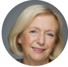
Prof. Dr. Johanna Wanka, Bundesministerin für Bildung und Forschung