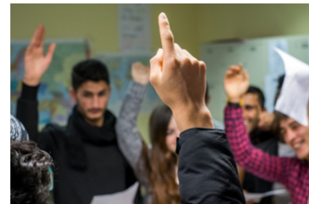
Strukturen stärken 2017