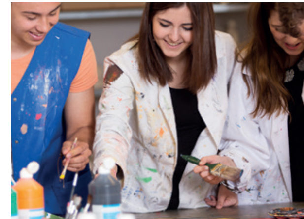
Strukturen stärken 2017