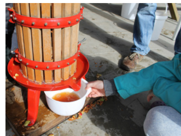
Strukturen stärken 2017